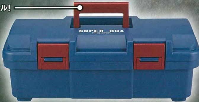
持ちやすいワイドハンドル!