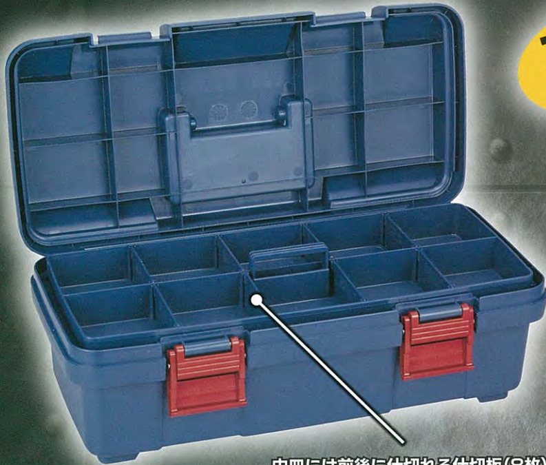
中皿には前後に仕切れる仕切板(8枚)付。